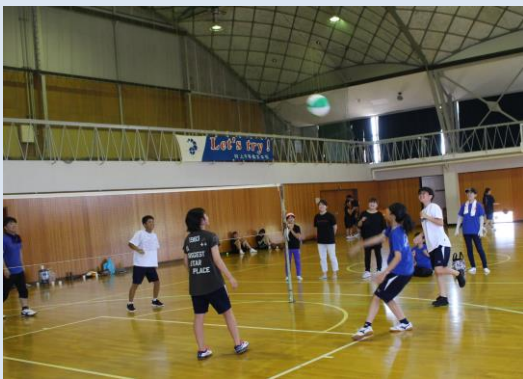
ビシバシとビーチボールを相手のコートに入れてました。