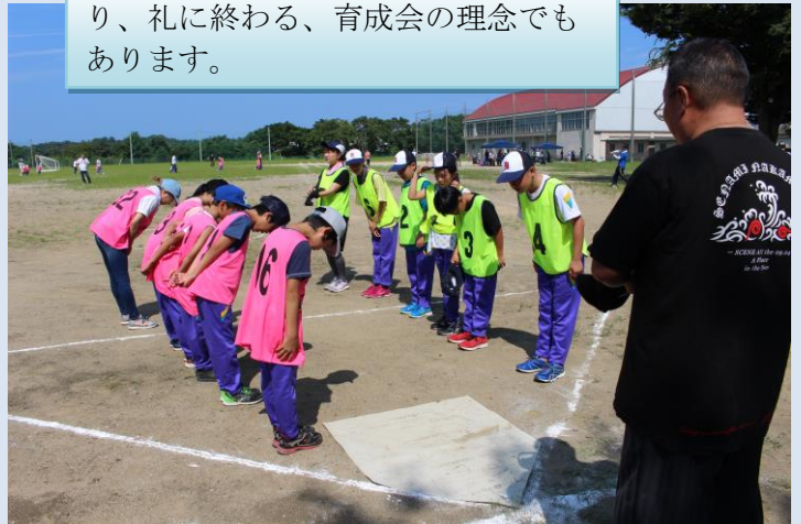
「よろしくお願いします!!」礼に始まり、礼に終わる、育成会の理念でもあります。