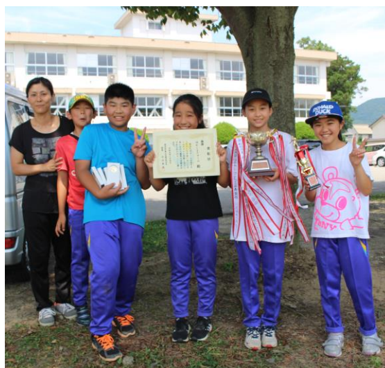
母子キックベース大会で優勝した 緑町一丁目Aチーム