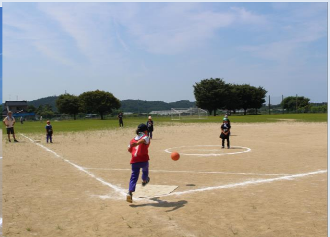
「えい」低学年キックベースでは、1・2年生たちが、小さい体をせいっぱい使って試合をしていました。