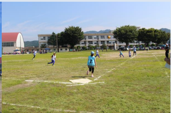
「いけ!!ボールよ、飛べ!!」母子キックベースでは、3塁打ラインを超えるキックもありました。