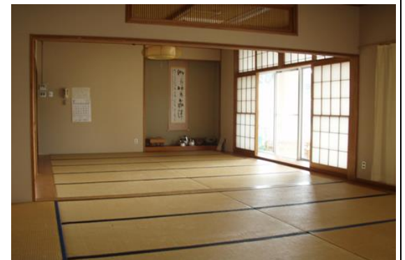
(センター1階 研修室)